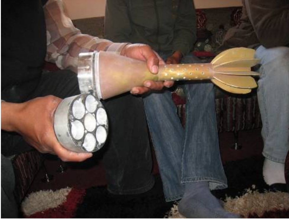
فوق: قبلة عنقودية - مصراته، ليبيا، 15 إبريل/نيسان. نص على الجانب يقول: SMM MAT-120 LOT 2-07

في وقت كتابة هذا التقرير كان في ليبيا نزاعاً مسلحاً غير دولي بين قوات القذافي ومقاتلي المعارضة. وهناك كذلك نزاع مسلح دولي بين ائتلاف يقوده حلف شمال الأطلسي وبين قوات القذافي. وقد وقعت الأغلبية الساحقة من الانتهاكات التي وثقتها منظمة العفو الدولية في سياق النزاع المسلح غير الدولي.