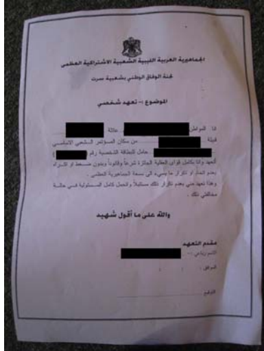
استمارة تعهد شخصي

وقال المحتجزون إنهم كانوا معصوبي العينين أثناء الاستجواب في سرت. وبعد إطلاق سراحهم، قالوا إنهم أُجبروا على التوقيع على "تعهد" بعدم تكرار ما يسيء إلى سمعة الجماهيرية العظمى والاعتراف بتحمل كامل المسؤولية للعواقب المترتبة على انتهاك هذا التعهد. بيد أن مثل هذه التعهدات، لم تحل، على ما يبدو، دون مضايقات قوات القذافي؛ وتعلم منظمة العفو الدولية بحالة شخص واحد على الأقل أُلقي القبض عليه في مصراتة بعد التوقيع على هذا التعهد.