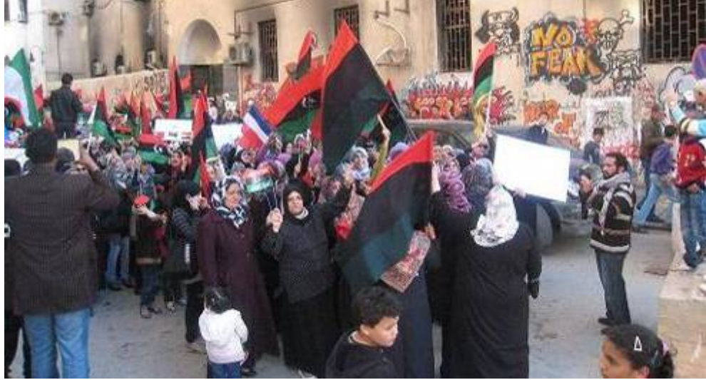
نسوة يتظاهرن في بنغازي

بوحى من الإطاحة بالرئيسين المعمرين في تونس ومصر المجاورتين، استخدم الليبيون مواقع التواصل الاجتماعي الإلكترونية للدعوة لاحتجاجات مناهضة للحكومة في 17 فبراير/شباط 2011. وتعود أهمية التاريخ إلى 17 فبراير/شباط 2006، عندما قتلت قوات الأمن ما لا يقل عن 12 شخصاً وأوقعت عشرات الجرحى في احتجاج في بنغازي لم يدع إلى تغيير سياسي؛ وإنما عبّر عن الغضب إزاء الرسوم الكاريكاتورية للنبي محمد التي نشرت في أوروبا فحسب.