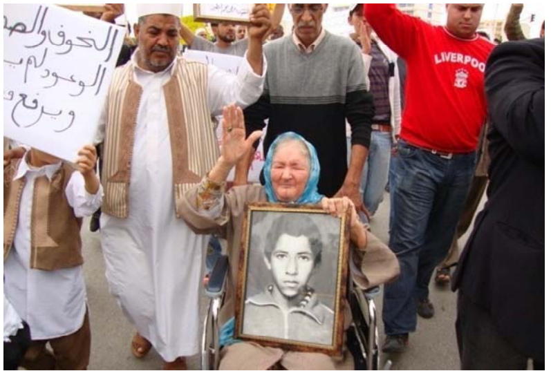
فوق: مرفق جهاز الأمن الداخلي في بنغازي، من بينها الكتابة على أبواب الزنازين؛