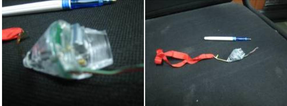
فوق: أدوات آمنة / لتزويد ذخائر عنقودية من طراز MAT-120

وكما أشير فيما سبق، فإن القانون الإنساني الدولي يحظر أيضاً استعمال "الدروع البشرية". وهذا يعني إحضار مدنيين أو أشخاص آخرين ممن لا يشاركون في القتال إلى محيط أهداف عسكرية، أو وضع أهداف عسكرية بالقرب من مدنيين أو من أشخاص خرجوا من دائرة القتال، عن قصد، بغرض محدد هو محاولة منع العدو من استهداف الأهداف العسكرية. 65 واستعمال الدروع البشرية لا يمنح الحصانة للأهداف العسكرية من الهجوم بصورة آلية، أو العكس، ولكن يتعين أخذ الأشخاص الذين يستخدمون كدروع بشرية في الحسبان لدى تقرير ما إذا كان أي هجوم متناسباً أم لا، وكذلك التقيد بالتزام اتخاذ الاحتياطات اللازمة لتقليل الوفيات أو الإصابات إلى الحدود الدنيا.