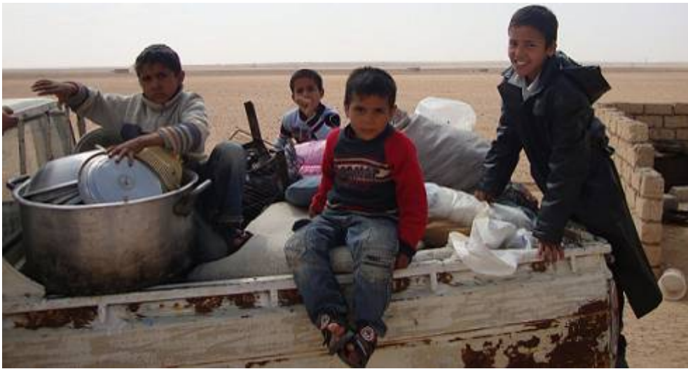
نازحون من أجدابيا عالقون في الصحراء لأسابيع

وقد أدى القتال إلى تشريد عشرات الآلاف من المدنيين، إذ فر العديد من أجدابيا والمناطق المحيطة بها. وشهدت الدول المجاورة نزوح عدد كبير من الليبيين والأجانب. وفي وقت كتابة هذا التقرير، كان قد فر من ليبيا ما يربو على