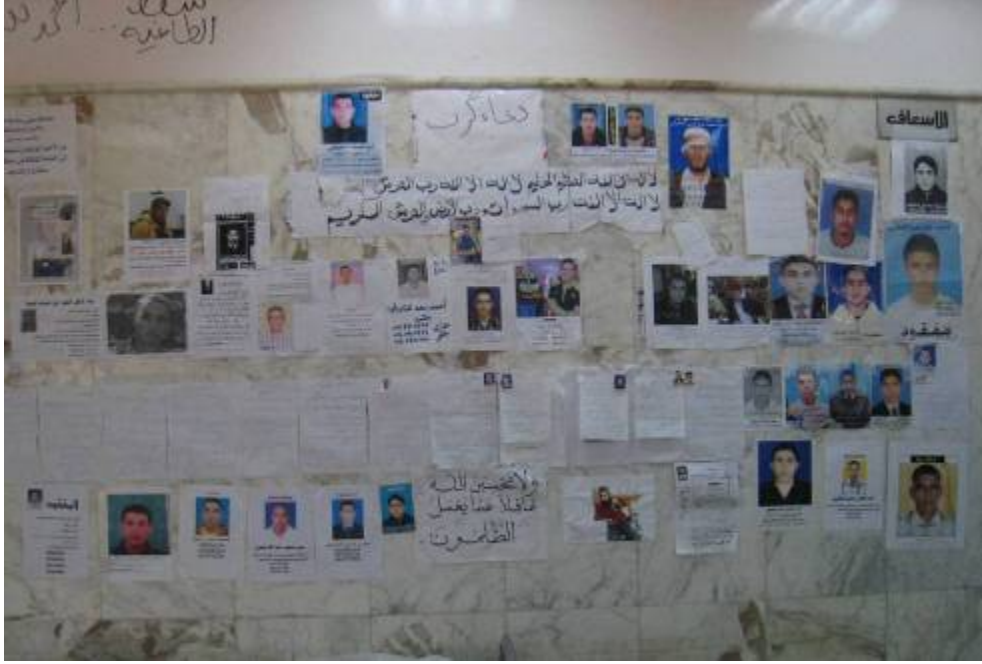
ملصق للمختفين، مستشفى الهواري، بنغازي