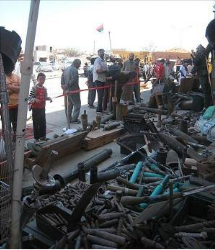
فوق: مئذنة محطمة في مصراتة؛ وأعلى: عرض للذخيرة في مصراتة