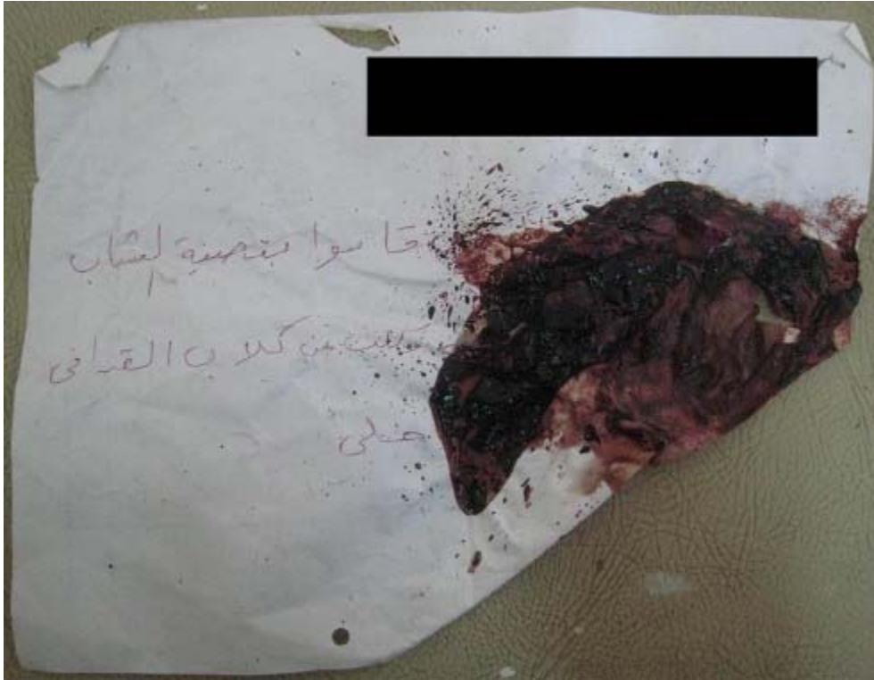
عبارة ملطخة بالدماء وجدت بجانب جثة أحد عناصر الأمن الداخلي السابق

تعرض للاستهداف موظفون نشطون في نظام العقيد القذافي، ولا سيما ضباط "جهاز الأمن الداخلي" وأعضاء اللجان الثورية والحرس الثوري. 139 فقتل بعضهم، بينما تعرض آخرون للاعتداءات وللاعتقال، أو هوجمت ممتلكاتهم وسلبت وأحرقت. وغادر العديد من هؤلاء المناطق التي تسيطر عليها المعارضة، بعضهم فور استيلاء المعارضة على هذه المناطق وآخرون عقب تلقيهم تهديدات بأنهم سوف يستهدفون.