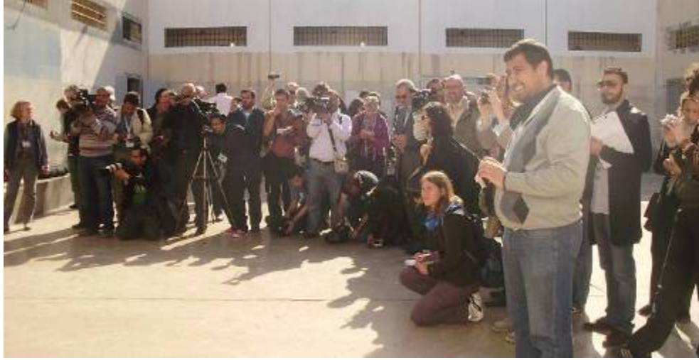
صحفيون أجانب يصورون مهاجرين أفارقة من جنوب الصحراء (يفترض أنهم مرتزقة تم إطلاق سراحهم فيما بعد)

سائداً بين السكان في المناطق الخاضعة لسيطرة المعارضة، وأدت إلى تغذية العنصرية المتفشية وكرهية الأجانب في ليبيا، وأوحت بأنه من المسموح به ارتكاب الانتهاكات ضد الرعايا الأجانب من جانب المجلس الوطني الانتقالي.