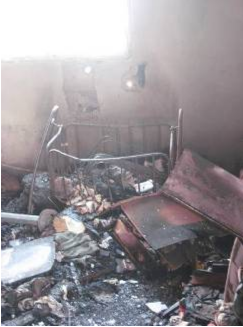
الطابق الثاني لبيت تم تدميره على أيدي قوات المعارضة في بنغازي

أقدم مقاتلو المعارضة وأنصارها على اختطاف أفراد سابقين في قوات الأمن وأشخاصاً اشتبه بأنهم موالون للقذافي، واعتقالهم تعسفاً وتعذيبهم وقتلهم، وكذلك أسروا جنوداً ومواطنين أجانب اشتبه بهم خطأ بأنهم مرتزقة يقاتلون في صفوف قوات القذافي. ولم يعرف عن فتح "المجلس الوطني الانتقالي" تحقيقات مستقلة أو ذات مصداقية في هذه الحوادث، أو اتخاذ تدابير فعالة لإخضاع المسؤولين عن هذه الانتهاكات للمحاسبة.