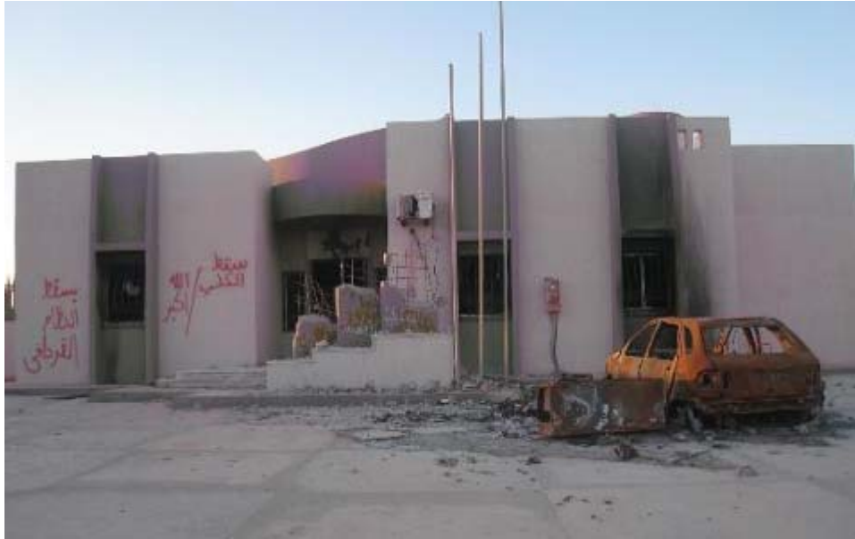
تمثال محطم للكتاب الأخضر في مصراته

حيث قامت السلطات بتفريق المتظاهرين باستخدام الأسلحة غير المميتة، مما أسفر عن إصابة عشرات الأشخاص، ولكنها سرّعت مع ذلك في الإفراج عن الرجلين. ولم تجد أي استراتيجية عمل في كبح احتجاجات بنغازي في 17 فبراير/شباط، والتي امتدت إلى مدن أخرى، بما في ذلك إلى الزنتان في جبل نفوسة؛ والكفرة البعيدة في الجنوب الشرقي؛ والزاوية وزوراء في الغرب؛ والبيضاء ودرنة وطبرق في الشرق.